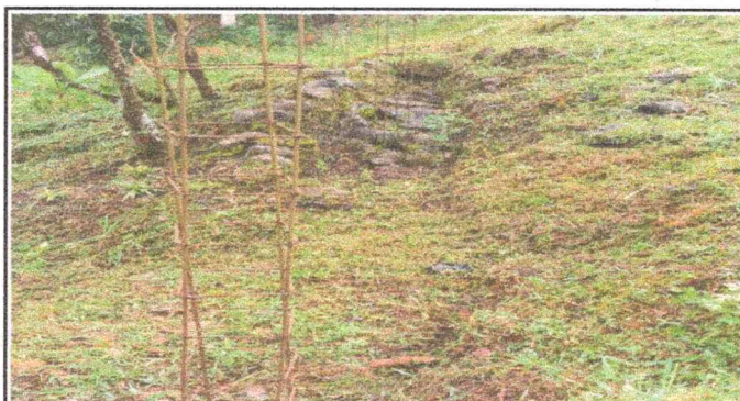
Foto 4: Vista la direccion del establecimiento esta en peligro de deslizamiento de tierra por lo que es necesario la rehabilitación de un muro de una longitud de 36 mts. Modulos IV