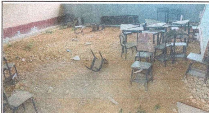
Foto 2: se observa claramente la necesidad rehabilitación de entortado, de un aula de 8X8 m2.