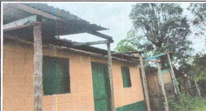
Foto 1: Vista frontal de la cocina del Establecimiento donde se refleja el mal estado en que se encuentra el entchado del mismo (laminas y paredes). Modulos I