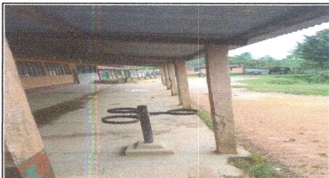
Foto 3: Se observa claramente la necesidad de sustituir la estructura de madera en mal estado del corredor y Sustitucion de pisos, de una longitud de 24 mts X 5mts. Modulos III