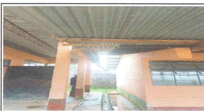
Foto 6: Vista el establecimiento en donde se refleja el mal estado la colocacion de canales y bajadas de agua pluvial.

Observación: Si es necesario se pueden agregar hojas adicionales y actualizar el número de hojas.